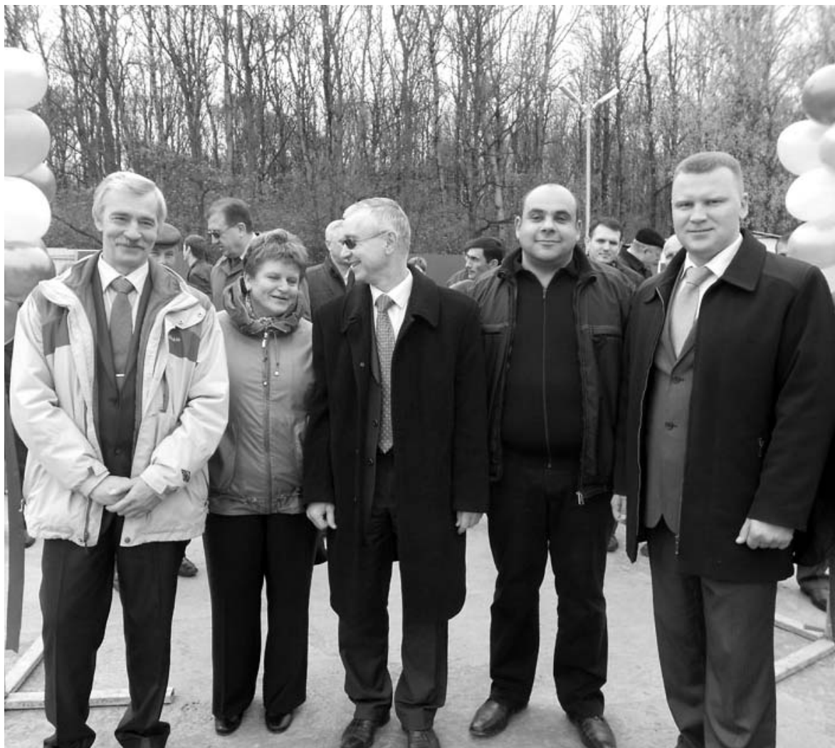
Участники торжественного открытия 2-ой очереди свинокомплекса.

оснащен высокотехнологичным оборудованием датской компании «Эгеберг», процесс производства